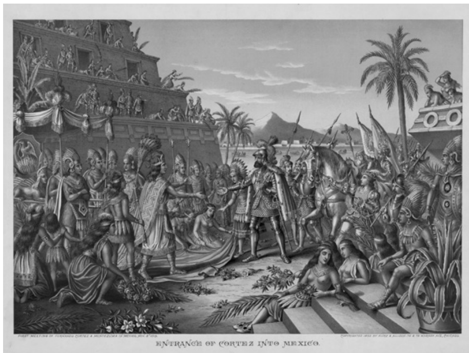
První setkání Hernánda Cortéze a Moctezumy II. dne 8. listopadu 1519.

skými kmeny (Totonaky a Tlaxcalany), z nichž se stali spojenci Španělů. Do Tenochtitlánu Cortéz vstoupil bez boje jako Moctezumův host. Umění diplomacie ale brzy přerostlo v bezohlednou manipulaci s hostitelem, který se stal Cortézovým zajatcem. Prostřednictvím Moctezumy se Španělé dočasně zmocnili vlády nad městem, které je oslnilo krásou svých domů, pyramid, chrámů a věží vyrůstajících z ostrůvků jezera. K problémům kontroly nad městem ale došlo v době Cortézovy nepřítomnosti, kdy jeho zástupce Pedro de Alvarada nechal ze strachu před spiknutím povraždit některé členy aztécké aristokracie, což vedlo k indiánskému povstání vůči uchvatitelům. V průběhu povstání zahynul rukou vlastních poddaných i Moctezuma, kterého jeho vlastní lid začal vnímat jako zrádce. Při ústupu Španělů z Tenochtitlánu, dne 30. července 1520, v neblaze proslulé Smutné noci ( Noche Triste ), bylo mnoho conquistadorů zabito nebo zajato a poté obětováno, aby svojí krví vzdali počtu aztéckým bohům. Hrůzný osud zajatých conquistadorů sugestivně popsal jeden ze španělských dobyvatelů Bernal Díaz del Castillo: „Když je dovedli nahoru, na malou plošinu, na vrchu svatyně, do blízkosti jejich proklatých mo-