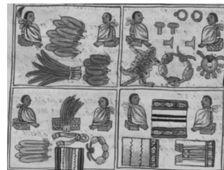
Florentský kodex popisuje aztécké mýty, zvyky, historii nebo sociální organizaci. Zobrazení aztéckých obchodníků prodávajících šperky, textilie, peří nebo kožešiny.

Bernardino de Sahagún se věnoval studiu aztécké kultury téměř padesát let. Při sběru empirických dat a poznatků využíval postupů, které předběhly svoji dobu. Informace získával formou rozhovorů s velkým počtem respondentů, komparoval jednotlivé výpovědi a ve svých zápiscích se snažil respektovat domorodou perspektivu dotazovaných. Své poznatky shrnul v knize Historia general de las cosas del reino de Nueva España (Obecná historie věcí království Nové Španělsko) , známé také pod názvem Florentský kodex . 8 Jedná se o bohatě ilustrovaný dvanáctidílný spis. Na 2 400 stránkách s 2 000 ilustracemi jsou téměř encyklopedicky popsány aztécké mýty, zvyky, oblečení a modlitby. Autor věnoval pozornost také přírodnímu prostředí, historii, sociální organizaci a společenské stratifikaci aztécké společnosti. Poslední díl, který také vznikl na základě vyprávění indiánů, je věnován dobytí Tenochtitlánu španělskými conquistadory. Jedná se sice o zprostředkovaný, ale svojí dikcí téměř antropologický popis života a smrti jedné z nejvyspělejších předkolumbovských kultur (León-Portilla 2002). 9