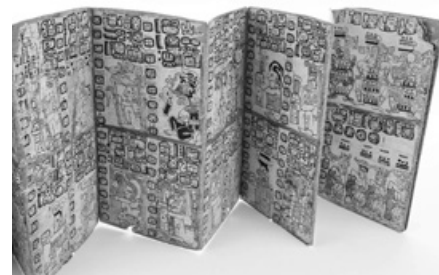
Jednotlivé stránky Madridského kodexu byly složeny jako harmonika, vyběleny vápnem a pomalovány pestrými barvami.

Zvláštní místo mezi mezoamerickými předkolumbovskými kodexy zaujímá Codex Borgia ,