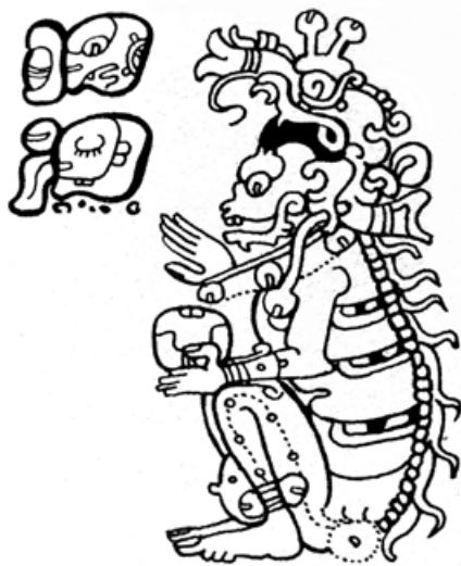
Mayský bůh smrti Ah Puch.