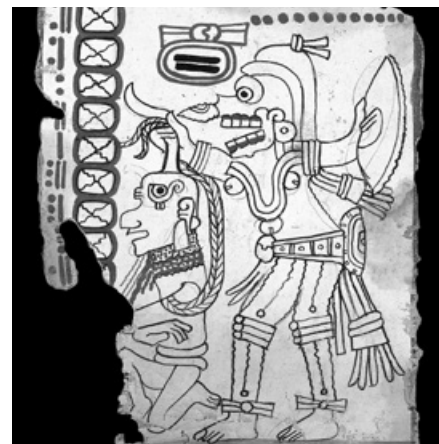
Mayský rukopis Grolier Codex zahrnuje ztvárnění boha smrti v podobě Tlahuizcalpantecuhtli.