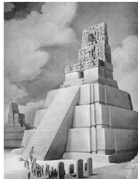
Mayská pyramida Velkého jaguára v Tikalu.

tologie, náboženství a filozofie. Významnou determinantou jejich života byla čísla, která využívali k matematickým výpočtům, architektonickým projektům, kalendářním záznamům, astronomickým tabulkám a cyklickému výkladu vývoje světa (Domenici 2006). Bohužel většina jejich literárních děl byla v průběhu španělské conquisty zničena kolonizátory, takže se zachoval pouhý zlomek indiánské literární tvorby.