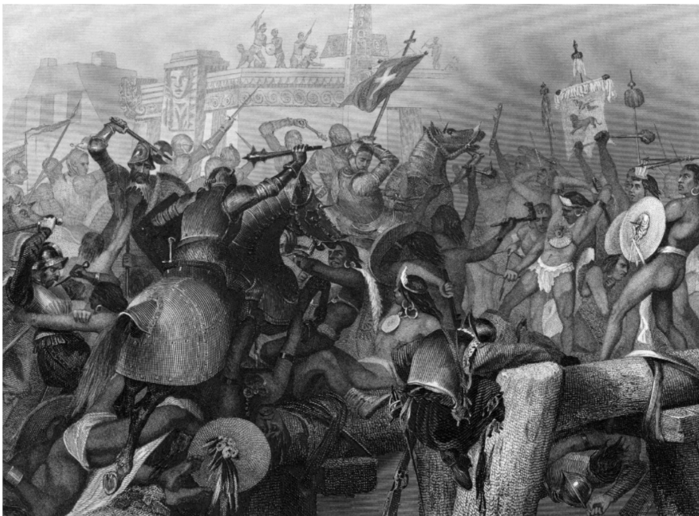
Dobytí Tenochtitlánu, hlavního města Aztéků, v roce 1521.

kameny, upravené pro obětování, noži z pazurku jim rozřízli hrud', vytrhli teplé srdce a to obětovali přítomným modlám, kdežto tělo chytily