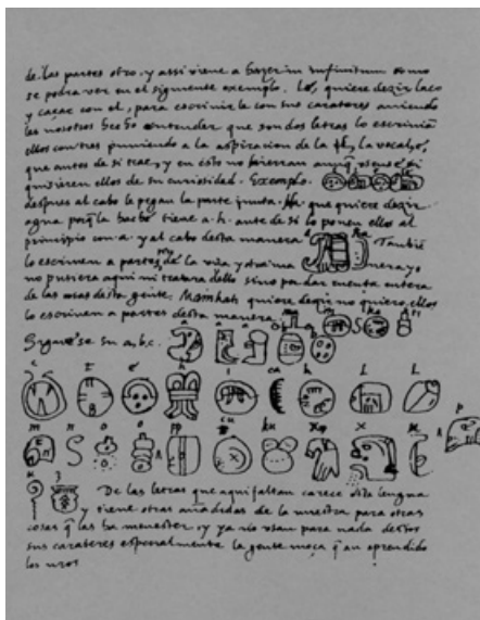
Klíčem v dosud bezvysledném úsilí o dešifraci mayského písma měla být abeceda sestavená Diegem de Landou.

biskupem Toralem poslán zpět do Španělska, aby se zde zpovídal za nezákonně vedené inkviziční procesy. V roce 1569 byl ale osvobozen a v roce 1571, dokonce jmenován španělským králem Filipem II. biskupem Yucatanu. Inkviziční činy, jichž se Diego de Landa dopustil na aztéckých domorodcích a jejich kulturním dědictví, jsou neodpustitelné. Nikdy se již nedovíme, kolik literárních a výtvarných děl nechal Diego de Landa ve jménu boje proti domorodému „modlářství“ zničit. Nezpochybnitelné ale je, že tím vědu připravil o nezastupitelné zdroje informací o aztécké kultuře a historii. O to více je paradoxní, že jeho životní dílo – kniha Relación de las cosas de Yucatán (Zpráva o záležitostech v Yucatanu, 1566), detailně popisující mayské náboženství, kulturu, zvyky a jazykový systém se stala základním zdrojem informací a poznatků o nativní kultuře Aztéků.