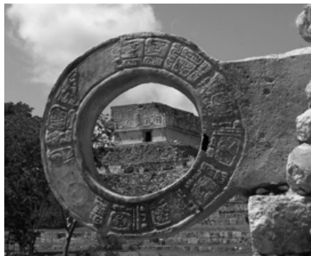
Dokladem vztahu Mayů ke smrti je také míčová hra („pok-a-tok“).

Literární prameny, jako například Madridský kodex , ale také malby na keramice a odkryté hroby, nám dokumentují nejen vztah Mayů k bohům, ale také jejich postoj k zesnulým panovníkům. Archeologické nálezy prokázaly, že současní pohřební výbavy byly četné obětiny, jako jsou náhrdelníky, náušnice, keramické nádoby a posmrtné masky z jadeitu. Významnou informací o mocenském statusu mrtvého, ale byla také poloha, v níž bylo jeho tělo, omotané bavlněným plátnem, pohřbeno. Prostí lidé byli obvykle pohřbíváni v natažené poloze na zádech. Oproti tomu, jedinci, kteří zaujímali ve společnosti významné postavení, byli často pohřbíváni vsedě se zkříženými nohama. O výjimečném statusu takto pohřbených příslušníků aristokracie svědčí skutečnost, že jejich hroby byly opakovaně otvírány, pravděpodobně proto, že potomci toužili po tom, poradit se v závažných životních rozhodnutích se svými předky (Bahn 2002). Dokladem vztahu Mayů ke smrti je také míčová hra („pok-a-tok“), která glorifikovala pohyb nebeských těles. Pravidla a náboženský smysl této hry s míčem jsou předmětem spekulací, ale je pravděpodobné, že její součástí byla „rituální smrt“ jako dobrovolná oběť vyvoleného hráče (nebo celého mužstva) slunečnímu božstvu.