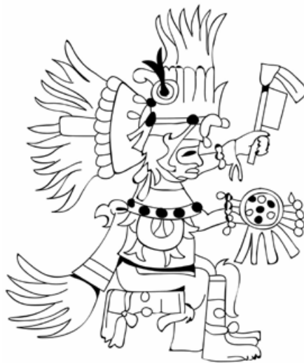
Mayský bůh války, násilné smrti a lidských obětí Buluc Chabtan. © Dorling Kindersley.

tropologii náboženství, tak antropologii smrti jako relativně nové, dynamicky se rozvíjející antropologické disciplíny.