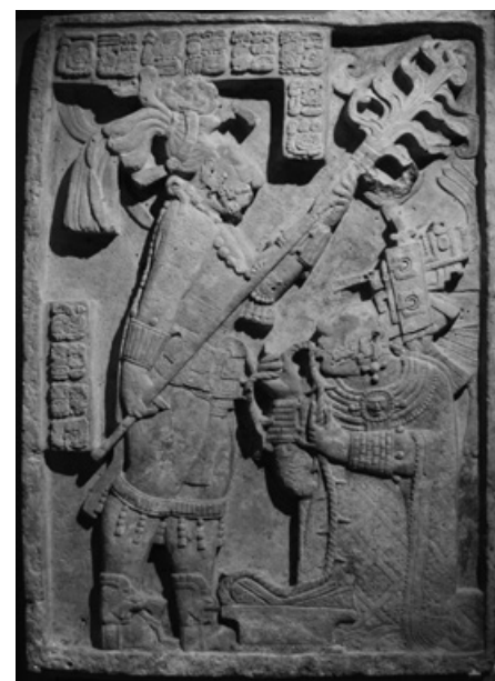
V nadpraží v Yaxchilánu je na reliéfu zobrazena královna Ix K'ab'al Xook při sebeobětování.

Vztah Mayů k utrpení a smrti se promítl také do symbolických představ spjatých s božstvem smrti, jímž byl mytologický Ah Puch. O významu, který Mayové tomuto bohu přičítali, svědčí četnost jeho zobrazení v mayských kodexech.