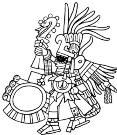
Bůh slunce, války a lidských obětí Huitzilopochtli.

Symbolem agresivní válečné kultury Aztéků byl bůh slunce a války, krvavý Huitzilopochtli („kouzelník kolibřík“). Příběh tohoto boha zapsal páter Bernardino de Sahagún (1499–1590), který v době španělské conquisty sbíral a popisoval mýty, zvyky a obyčeje předkolumbovských mezoamerických indiánů. 7 Matkou boha smrti byla podle pověsti vdova jménem Coatlicuae, která jednoho dne spatřila, jak se z nebe snáší oslnivá koule peří, již zachytila a skryla pod svůj oděv. Když ji poté marně hledala, zjistila, že je těhotná. V tu chvíli se dopustila fatální chyby, neboť o tom, co se stalo, vyprávěla své dceři. Ta se cítila do té míry dotčena, že přesvědčila své bratry „nesčetné obyvatele jihu“, aby matku zabili. Tomuto hrůznému činu ale zabránil Huitzilopochtli, který vyšel z těla Coatlicuae a nemilosrdně své nevlastní sestře usekl hlavu. Smrti neunikli ani „nesčetní obyvatele jihu“, které Huitzilopochtli dostihl na útěku a všechny pozabíjel. Poté co krvavě zachránil matku, vystoupal na nebesa a stal se bohem Slunce a války. Také v tomto mýtu je smrt součástí cyklické interpretace toku času. Na Coatlicuae je totiž možné pohlížet jako na bohyni země, která dává každé ráno život bohu Slunce – Huitzilopochtlimu, kterého ohnivý had Xiuhcoatl zdvihne na oblohu a umožní mu tak každý den zabít svoji nevlastní sestru Lunu a nesčetné obyvatele jihu – hvězdy.