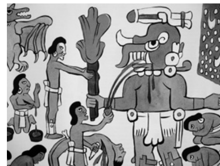
Mexický malíř Diego Rivera doprovodil akvarelovými ilustracemi knihu Popol Vuh . Ústřední postavou byl bůh Tohil, který byl spojován s obětováním.

vynesli na zem a zavěsili na větvě stromu, který nerodil. Od této chvíle ale strom získal životodárnou sílu a začal plodit. Když se o tomto zázraku dozvěděla mladá bohyně Ixquic, navzdory božským zákazům se ke stromu přiblížila. Hlava Hunahpú ihned této příležitosti využila, skočila do jejích rukou a magicky, pomocí své sliny, ji oplodnila. Narozená dvojčata byla opět vystavená úkladům všudypřítomné smrti. Nezahynula ani v mraveništi všežravých mravenců a na své cestě do podsvětí dokázala čelit nástrahám podsvětních bohů Xibalby, které nakonec usmrtili. Bůh nebes Huracán, jenž ocenil odvahu dvojčat, je svým dechem vynesl z podsvětí na oblohu, kde se proměnili ve Slunce a Měsíc. Svůj vítězný boj se smrtí dovršilo Slunce tím, že nechalo dozrát kukuřičné klasy, které nechalo ochutnat bohům. Ti byli jejich chutí tak oslněni, že z kukuřice stvořili lidi. Tentokrát ale byli lidé tak moudří a dokonalí, že se podobali bohům. Ti proto seslali na zemi lehký opar, který „lidem kukuřice“ lehce zamlžuje zrak a snižuje nekonečnou lidskou touhu po poznání.