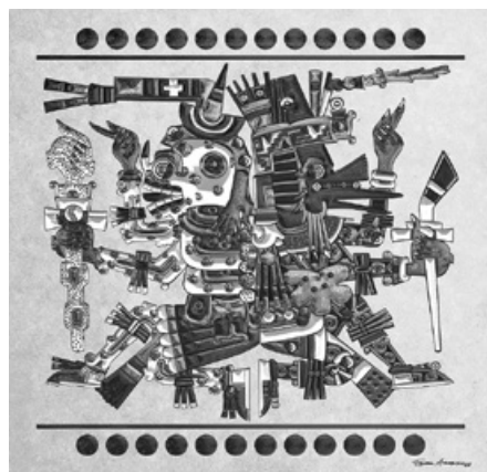
Bůh smrti Mictlantecuhtli a bůh větru a moudrosti Quetzalcoatl se objevují na stránkách Codexu Borgia .

Mytologické představy Mayů o vzájemném sepetí života a smrti se promítaly také do krvavých obřadních praktik. Jejich součástí byly