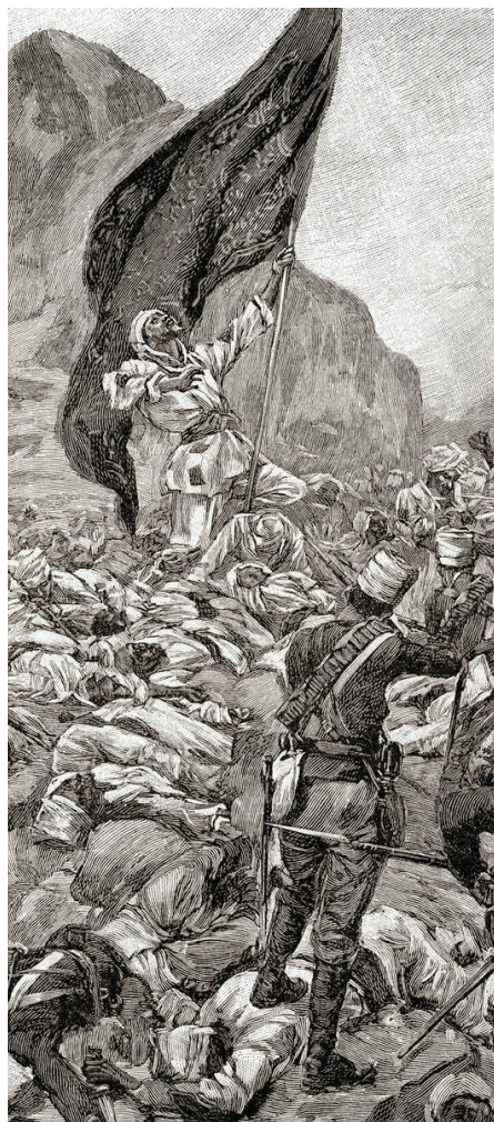
Bitva u Omdurmánu, The Century Edition of Cassell's History of England (1900).

V průběhu 19. století se museli nejen súdánští muslimové, ale i muslimové obývající celý Přední Východ, vyrovnávat s narůstajícím vlivem Evropanů, a tedy i s jistou emancipací místních křesťanských církví, které znala Evropa jako východní křesťany. Evropský mocenský tlak vyústil na jedné straně ve sjednocující proud různých muslimských náboženských skupin a bratrstev, na druhé straně vyvolal vzrůstající nepřátelství muslimské většiny vůči