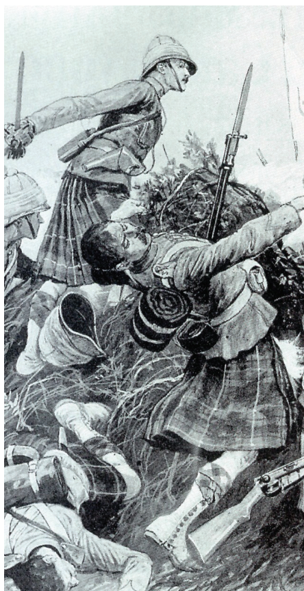
Black and White: War Albums, Soudan No. 2: Atbara.

Odbyt trofejních zbraní mahdistů byl tak úspěšný, že se skoro okamžitě rozběhla místní výroba falzifikátů. Dají se poměrně snadno odlišit od skutečných zbraní: čepele jsou vyrobeny z páskové oceli a bývají kratší a oheb-