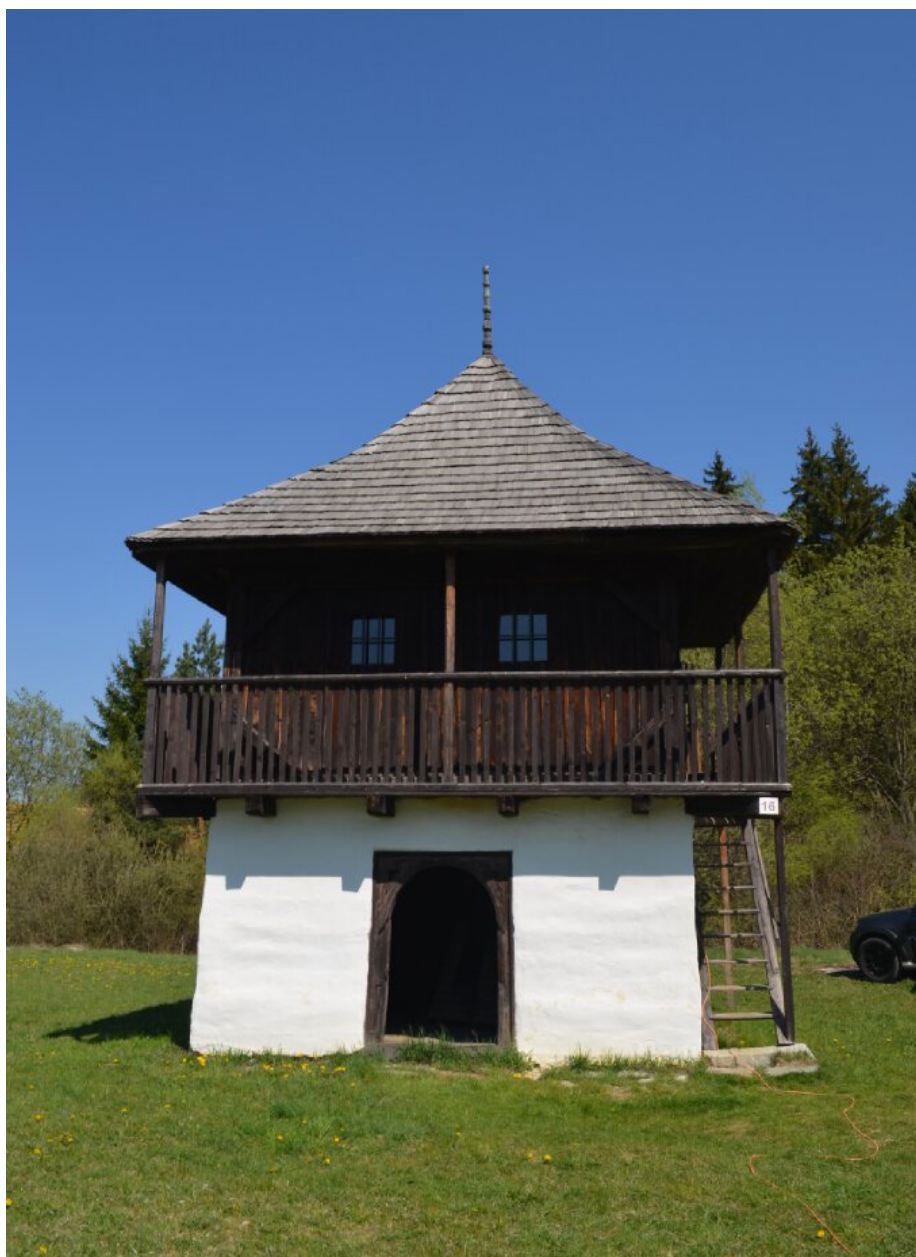
Filagória zo Slovenského Pravna, Slovenské národné múzeum v Martine – Múzeum slovenskej dediny.