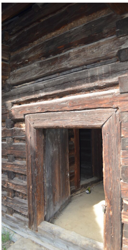
Boční vchod do zrubového obytného domu ze Štiavniky č. 348, Slovenské národné múzeum v Martine – Múzeum slovenskej dediny.

S transformací hladkého ve stále výrazněji rýhované mění se též zásadně vztah nejenom ke krajině, ale k přírodě vůbec. Bývalo všeobecným zvykem nechávat za pěkného počasí dveře do domu otevřené. V době hliněných podlah drůbež volně nocovala v síni na žebříku vedoucím na půdu a volně se pohybovala i v jizbě. Roubené domy v karpatské oblasti měly vedle vstupních dveří při zemi otvory pro přívod čerstvého vzduchu a také se jimi mohla protáhnout kuřata, housata, kočky a někdy i slepice. Život se zvířaty, všudypřítomné sepětí s přírodou bylo v roubenkách životní realitou. S exploatací krajiny, s rozvojem městského živlu, výstavbou průmyslových zařízení a se silícím vlivem centra a byrokracie se vztah k přírodě stává stále více zprostředkovaný a odcizený (Macúrek 1959).