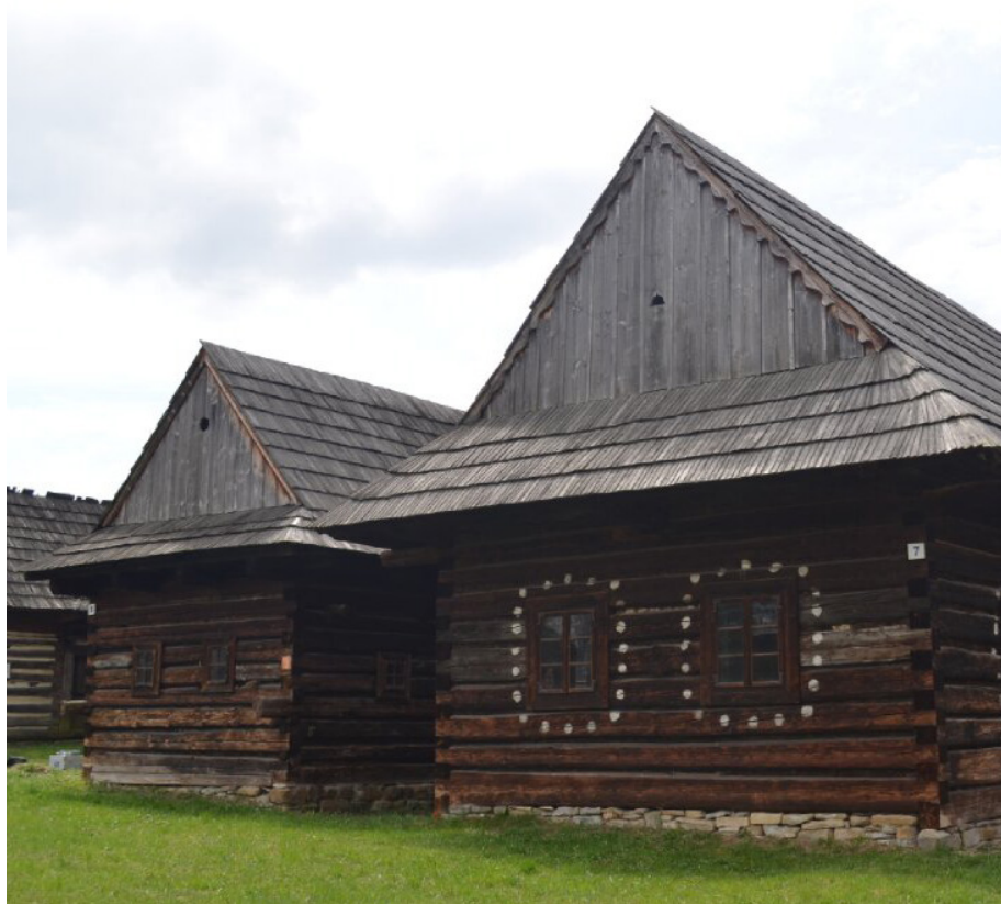
Zrubový obytný dom ze Štiavniky č. 348, Slovenské národné múzeum v Martine – Múzeum slovenskej dediny.

Situace v regionu se začíná radikálně měnit s 15. a 16. stoletím. Intenzivní obhospodařování pozemků vedlo k devastaci krajiny, zejména v důsledku neúměrné pastvy dobytka, těžby a zpracování železné rudy, pálení dřevěného uhlí, výroby potaše a krajně devastáční vliv na odlesňování rozsáhlých území měly horské sklárny. Krajina souvislého lesního porostu se